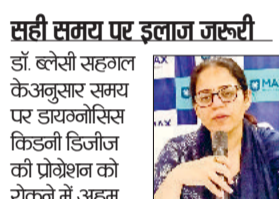
सही समार पर इलाज जरूरी