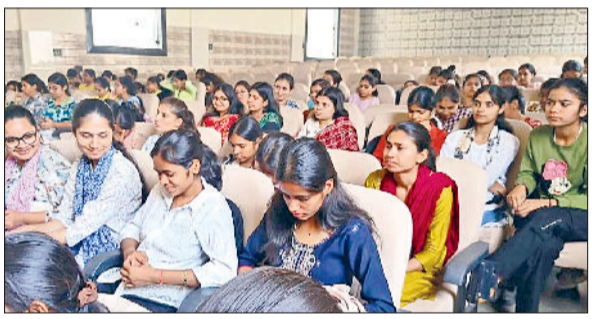
बाहदुरगढ़। संगोष्ठी में उपस्थित वैश्य कॉलेज की छात्राएं।