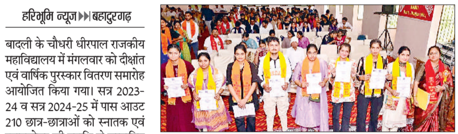
बाहदुरगढ़। समारोह में उपस्थित डिग्री प्राप्त विद्यार्थी व अन्य।