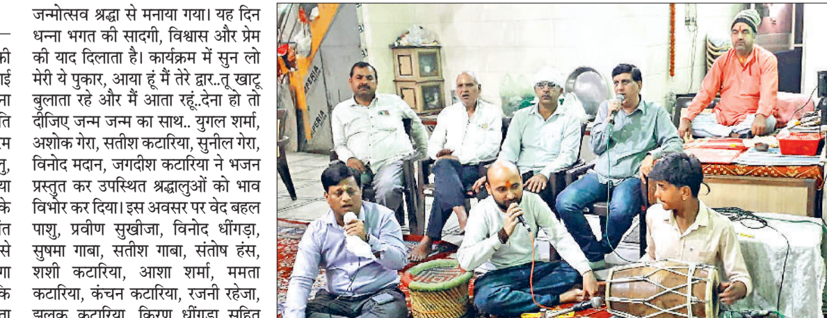
झज्जर। श्रीराम मंदिर में भजनों की प्रस्तुति देते हुए गायक कलाकार।