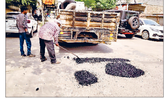
बहादुरगढ़। बालोर रोड पर भरे जा रहे गड्डे।

लंबे समय से गड्डों के शिकार बालोर रोड की आखिरकार सुध ली गई। सीएम के आगमन से कुछ समय पहले ही एकाएक तारकोल से गड्डों को भरने का काम शुरू किया गया। दरअसल, मंगलवार को मुख्यमंत्री नायब सैनी ने विधायक राजेश जून के पुत्र सचिन जून के विवाह समारोह में शिरकत की। मुख्यमंत्री का हेलीकॉप्टर बालोर रोड स्थित कॉलेज परिसर में उतरा, जिसके बाद वे सड़क मार्ग से आयोजन स्थल तक पहुंचे। उनके आगमन से कुछ घंटे पहले ही पैचवर्क किया गया। कॉलेज के आसपास और आयोजन स्थल तक जहां-जहां सड़क क्षतिग्रस्त थी, वहां गड्डों को तारकोल से भरकर समतल किया गया। स्थानीय निवासियों का कहना है कि बालोर रोड पर लंबे समय से सड़क बदहाल थी और गड्डों के कारण लोगों को रोजाना