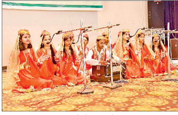
झज्जर। कार्यक्रम के दौरान कबाली की प्रस्तुति देती छात्राएं।