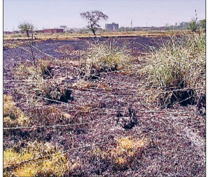
बहादुरगढ़। आग बुझने के बाद राख में तब्दील फसल।

वहीं, खरहर, भापडोवा, मांडोठी, बराही, कानोदा और कुलासी समेत कई गांवों के खेतों में फसल अवशेष जलने की घटनाएं सामने आईं। आग लगने का कारण स्पष्ट नहीं है लेकिन आंधी-तूफान के चलते आग ने तेजी से फैलाव किया। दमकल विभाग की टीमों को कड़ी मशक्कत करनी पड़ी। रातभर गाड़ियां इधर से उधर दौड़ती रहीं। कुछ जगहों पर तो टीम पहुंच ही नहीं सकी। बता दें कि क्षेत्र में इन दिनों भीषण गर्मी के चलते कचरे के ढेरों और सूखी झाड़ियां में आग लगने की घटनाएं लगातार बढ़ रही हैं। कई स्थानों पर