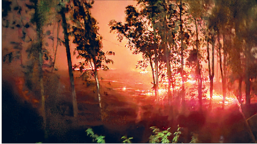
झंझर। खेतों में लगी आग की वजह से अधिकतर जगह चारे और पेड़ों को नुकसान पहुंचा।

इस दौरान करीब चालीस शिकायतें मिलीं। कर्मचारी भी अपनी ड्यूटी निभाते हुए आग लगने वाले स्थानों पर पहुंचे। ऐसे में कहीं-कहीं ऐसा भी रहा जब ईंधन में लगी आग पर लोगों द्वारा पहले से ही काबू करने का प्रयास किया जा रहा था। मुख्यतः डीघल, धांधलान, बिसाहन, ढाकला, कासनी, अंबोली, औरंगपुर, जौधी, बिरधाना, राजकीय