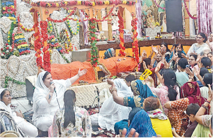
झज्जर। प्रेम मंदिर में भजनों का आनंद लेते हुए श्रद्धालु।