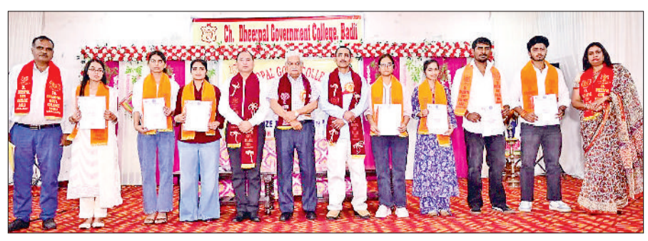
बाहदुरगढ़। अतिथियों व प्रिंसिपल के साथ डिग्री प्राप्त विद्यार्थी।

खेलों में शानदार प्रदर्शन करने वाले युवाओं को किया पुरस्कृत पारितोषिक वितरण समारोह में सत्र 2023-24 और 2024-25 के दौरान शैक्षणिक, सांस्कृतिक, खेलकूद, एनसीसी, एनएसएस और यूथ रेडक्रास क्लब की गतिविधियों में शानदार प्रदर्शन करने वाले विद्यार्थियों को पुरस्कृत किया गया। कुल 116 स्वर्ण पदक, 75 रजत पदक, 75 कांस्य पदक तथा 162 कॉलेज कलर प्रदान किए गए। शानदार शैक्षणिक प्रदर्शन के लिए 66 स्वर्ण पदक, 62 रजत पदक, 60 कांस्य पदक और 66 कॉलेज कलर, सांस्कृतिक गतिविधियों में उत्कृष्ट प्रदर्शन के लिए 02 स्वर्ण पदक, 01 रजत पदक, 02 कांस्य पदक, 08 कॉलेज कलर और 82 मेरिट सर्टिफिकेट, खेल गतिविधियों में उत्कृष्ट प्रदर्शन के लिए 48 स्वर्ण पदक, 12 रजत पदक, 12 कांस्य पदक और 76 कॉलेज कलर, एनएसएस में उत्कृष्ट प्रदर्शन के लिए 04 कॉलेज कलर, एनसीसी में उत्कृष्ट प्रदर्शन के लिए 08 कॉलेज कलर और 20 मेरिट सर्टिफिकेट, वाईआरसी में उत्कृष्ट प्रदर्शन के लिए 01 कांस्य पदक और 08 मेरिट सर्टिफिकेट प्रदान किए गए। हॉकी, वाणिज्य, गणित, कम्प्यूटर विज्ञान, मनोविज्ञान तथा जनसंचार एवं पत्रकारिता विषयों के 135 स्नातकोत्तर तथा बीए, बीएससी, बीकॉम, बीसीए व बीबीए के 140 स्नातक विद्यार्थियों को डिग्री प्रदान की गई। संगीत मध्यमतर में डॉक्टर तमसा के नेतृत्व में संगीत विभाग के विद्यार्थियों ने कबाली की शानदार प्रस्तुति दी और डॉक्टर कविता के मार्गदर्शन में एनसीसी कैडेट्स ने सांस्कृतिक कार्यक्रम प्रस्तुत किया।