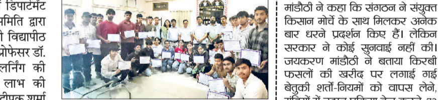
बहादुरगढ़। विजेता विद्यार्थियों को पुरस्कार करते प्रिंसिपल व अन्य।